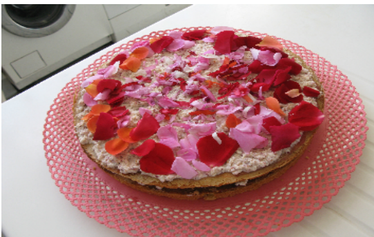
Rosen – Seminar am 28. August 2011